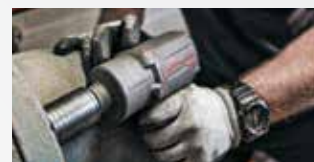
Underhåll av anläggningar