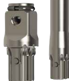
AK42H Jeu de 2 pièces : 1/2" x 2" (50 mm)