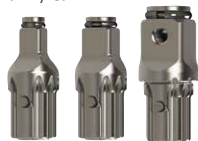
AK33H Jeu de 3 pièces : 3/8", 1/2", 3/4"