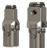
AK62H Jeu de 2 pièces : 1/2", 3/4"