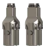
AK32H Jeu de 2 pièces : 3/8", 1/2"