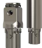
EAK62H Jeu de 2 pièces : 3/4", 3/4" x 6" (150 mm)