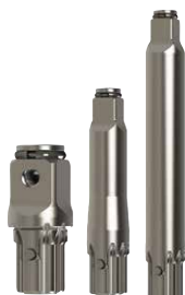
AK43H Jeu de 3 pièces : 3/4", 1/2" x 2" (50 mm) 1/2" x 4" (100 mm)