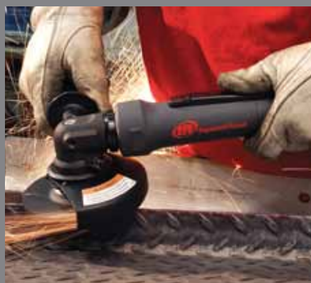
Sbavatura e finitura dei bordi