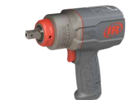
2236QPTiMAX 标准插销式驱动方头