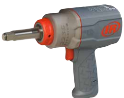
2236QTiMAX-2 2" 加长卡环式驱动方头