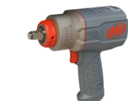
2236QTiMAX 标准卡环式驱动方头