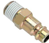
IB6NMC2 88103015 Stecknippel Baureihe IBN/IBS, Außengewinde 1/4", Bohrung 6 mm (ISO6150B / MIL-C4109)