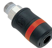
Schnellwechsel-Kupplungen Das Gesamtsortiment finden Sie in unserem Zubehörcatalog.