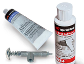
67-LBK1 04637344 Schmiermittel-Kits für Winkelköpfe