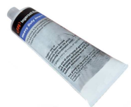
67-4T 04637336 Fett für Winkelköpfe mit hoher Drehzahl