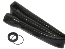
LG1-K284 80152119 Abluft-Ableitsatz Teile