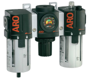
Filter, Regler, Öler Das Gesamtsortiment finden Sie in unserem Zubehörcatalog.