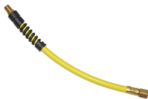
33104 91486330 Handschlauch, 1/4" NPT, Bohrung 6 mm, 30 cm