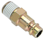
77NMC2 88104070 Stecknippel Baureihe 7N7/7S7, Außengewinde 1/4", Bohrung 7,2 mm (EURO 7,2 - 7,4)